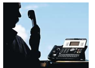
Betrüger geben sich am Telefon gern als Mitarbeiter der Sparkasse aus.

Da zurzeit viele Menschen zu Hause und deshalb beim Online-Shopping unterwegs sind, noch ein wichtiger Hinweis: „Seien Sie bei besonders günstigen Schnäppchen misstrauisch, insbesondere, wenn Sie dafür Vorkasse leisten sollen. Es gibt Hinweise, dass die Zahl der Fake-Shops massiv ansteigt. Ein gesundes Misstrauen bei allzu verlockenden Angeboten schadet nicht.“