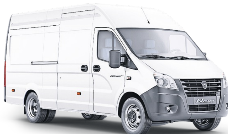
So sieht der erste Wagen der Modellreihe EFA-S E 35 aus, für den verschiedene Aufbauten möglich sind.

Die Verkaufsberater sollen künftig den Kunden umfassend über die technischen Details und Einsatzmöglichkeiten beraten. In diesem Zusammenhang wird es auch Hilfestellung bei der Beantragung von Fördermöglichkeiten mit der Beschaffung eines E-Transporters geben. So sind natürlich die obligatorische Befreiung von der Kfz-Steuer und ab diesem Jahr die 50-prozentige Sonderabschreibung auf den Kauf möglich, erläutert der Unternehmer finanzielle Vorzüge. Weitere Landes- und Bundesförderprogramme sind ebenfalls zum Erwerb von Elektrofahrzeugen eingerichtet, wie Pieniak betont. „Kunden können bei einer entsprechenden Zuschussung von bis 50 Prozent der zusätzlichen Kosten im Vergleich zu einem konventionell angetriebenen Fahrzeug profitieren“, beschreibt er die Finanzierung der E-Transporter. Die Lieferzeit beträgt nach der erfolgten Bestellung zwischen vier bis sechs Wochen. Das E-Fahrzeug wird mit einem eigenen Transport-Lkw des Proraer Unternehmens in Zell unter anderem von der Firma EFA-S abgeholt.