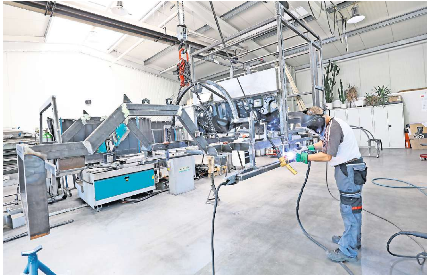
Bei der Sightseeing Trains Rügen GmbH stehen seit Jahren Fahrzeuge mit Elektroantrieb im Mittelpunkt der eigenen Produktion.